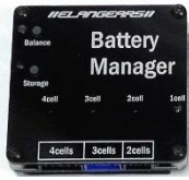
배터리 매니저 본체