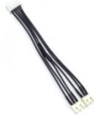
2셀 직렬 4셀 연결 케이블